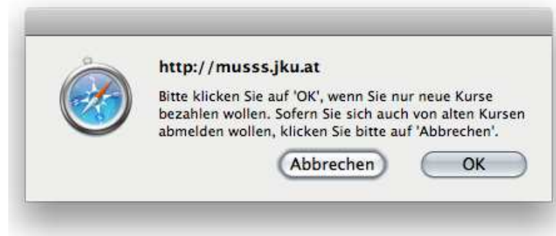
Abbildung 9: Dialogfenster zur Auswahl der Stornierung