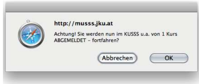
Abbildung 14: Dialogfenster zur Bestätigung der Stornierung