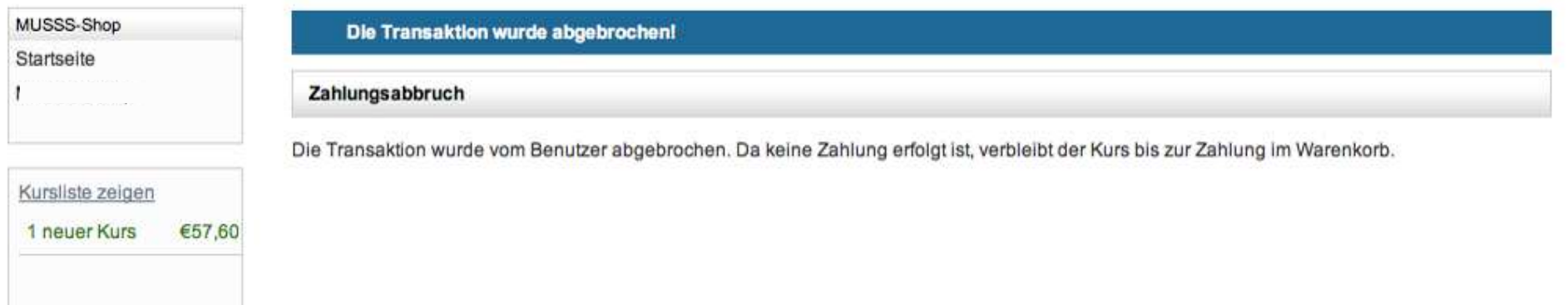
Abbildung 8: Keine Zuteilung des MUSSS-Kurses nach Abbruch der Qenta-Transaktion