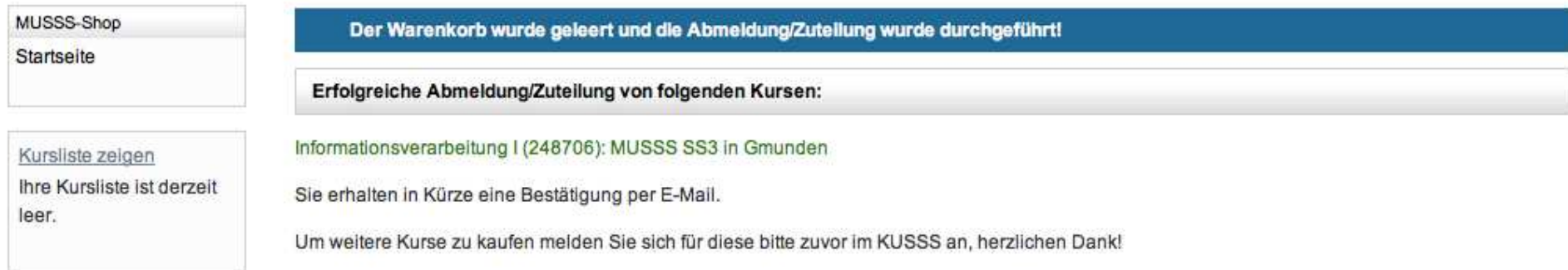
Abbildung 7: Erfolgreicher Kauf eines MUSSS-Kurses nach Bezahlung über Qenta