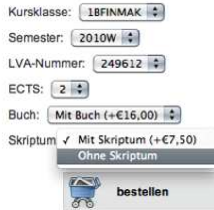
Abbildung 18: Optionen zur Materialauswahl